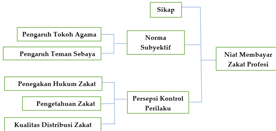
Gambar 2. Kerangka Penelitian

Skema diatas menggambarkan kerangka konseptual penelitian atau model yang diusulkan. Terdapat 3 variabel bebas yaitu sikap, norma subyektif dan persepsi kontrol perilaku yang diduga ada hubungan signifikan dengan niat menunaikan zakat yang merupakan variabel terikat, 2 variabel yang memperkuat (moderasi) norma subyektif dan 3 variabel yang memperkuat (moderasi) persepsi kontrol perilaku. Sesuai dengan literatur yang ditelaah dan bersandar pada teori yang mendasari, sikap, norma subyektif dan persepsi kontrol perilaku diasumsikan mempengaruhi langsung niat membayar zakat, lalu norma subyektif terhadap niat membayar zakat memiliki dua variabel yang memperkuat yaitu pengaruh tokoh agama dan pengaruh teman sebaya. Selanjutnya, persepsi kontrol perilaku yang dirasakan terbagi menjadi 3 variabel yang memperkuat yaitu pengetahuan zakat, penegakan hukum zakat serta kualitas distribusi zakat.