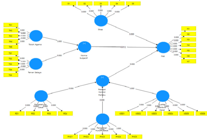
Gambar 1. Nilai P Value Model Struktural

Berdasarkan Tabel 7 dan Gambar 5 dapat dilihat bahwa terdapat 6 variabel laten eksogen, yaitu variabel sikap, tokoh agama, teman sebaya, pengetahuan zakat, penegakan hukum zakat, dan kualitas distribusi zakat. Selain itu terdapat 3 variabel laten endogen, yakni niat, norma subjektif dan persepsi kontrol perilaku. Dengan demikian, pada kasus ini terdapat 3 persamaan struktural yang terbentuk. Berdasarkan persamaan struktural tersebut selanjutnya dapat diturunkan sebanyak 8 hipotesis yang berkaitan dengan hubungan langsung di antara variabel laten di dalam model (lihat Tabel 12). Selanjutnya dengan menggunakan taraf nyata 5% dapat dilihat bahwa dari semua hipotesis yang tersedia memberikan 8 hipotesis yang memiliki kesimpulan Tolak H 0 , yang berarti hipotesis bahwa variabel laten eksogen berpengaruh signifikan terhadap variabel laten endogen diterima.